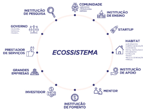
Figura 4. Abaixo do Ecossistema de Inovação. Fonte: Casar et al. (2020)

com as experiências de outros empreendedores e evitar cometer os mesmos erros.